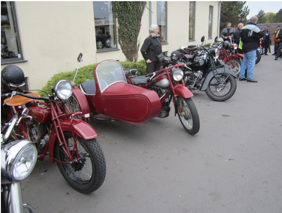
Udover os selv fra Indian Klub Danmark dukkede også andre indianere op.