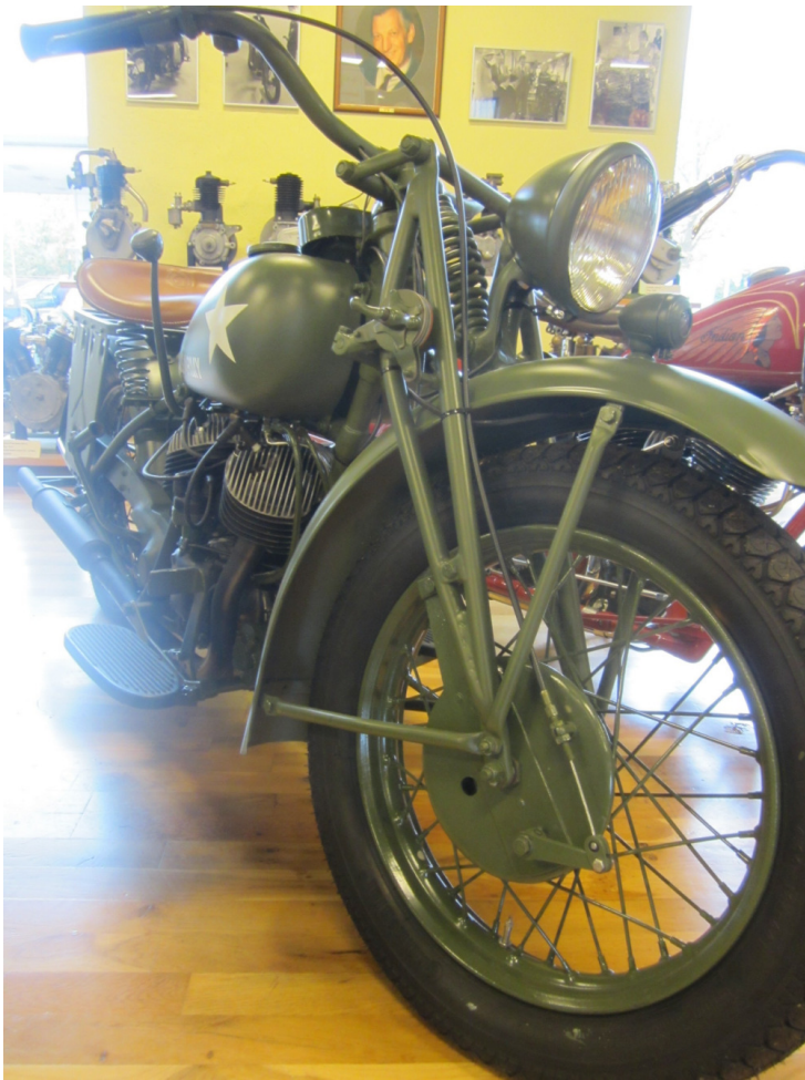
741'er udlånt af Jan Lund Jørgensen