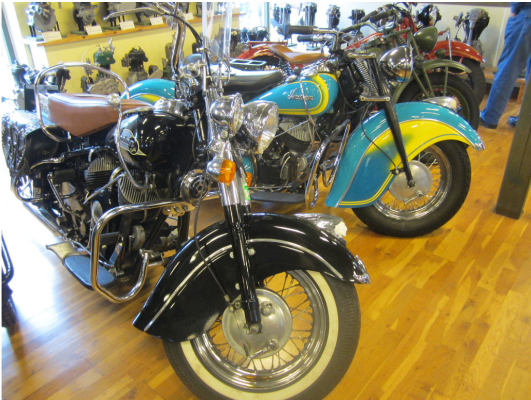
2 Chief'er udlånt af Jan Lund Jørgensen