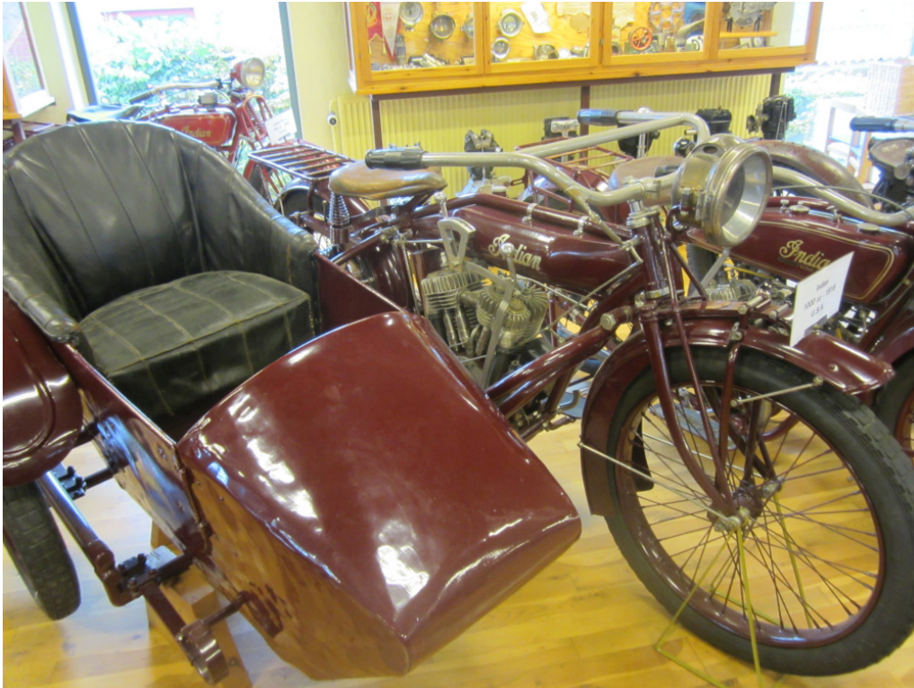
1000 cc 1916